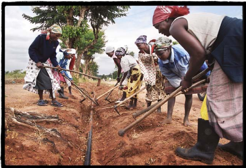
Die Bevölkerung hilft tatkräftig mit: Vergraben einer Leitung in Mosambik

sen. Wir danken Ihm an dieser Stelle für seinen unermüdlichen und wertvollen Einsatz. Wir wünschen Ihm bereits heute von Herzen beste Gesundheit, viel Zeit und Musse für den wohlverdienten Ruhestand!