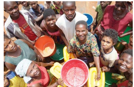
An einer Zapfstelle eines Helvetas Wassersystems in Mosambik