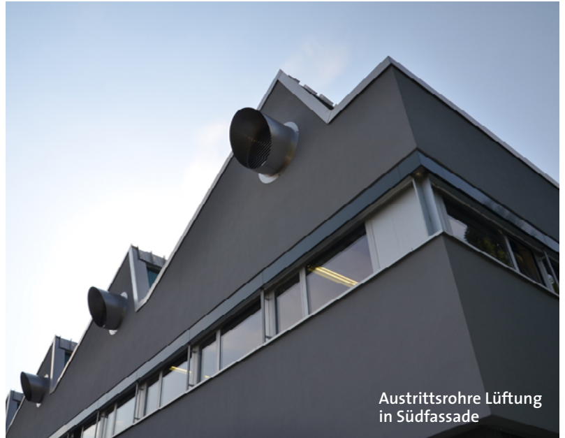
Austrittsrohre Lüftung in Südfassade

Mit der Erneuerung unseres ältesten Gebäudeteils konnten wir die letzte Etappe unserer Sanierung abschliessen. Dank Aussendämmung, neuen Fenstern und neuem Dach mit Minergie-Standard können wir Heizkosten einsparen und einen Beitrag zum Umweltschutz leisten. Die Innenerneuerung macht natürlich allen Mitarbeitern Freude und ist eine klare Aufwertung!